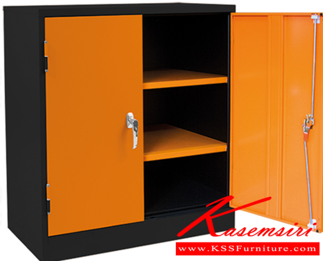
MCB36 ตู้เก็บเครื่องมือช่าง 2 บานเปิด ( 2 แผ่นชั้น ) 916(W) x 457(D) x 900(H) mm.