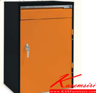
MGC36 ตู้เก็บเครื่องมือช่าง 1 บานเปิด 1 ล็อก 616(W) x 457(D) x 900(H) mm.