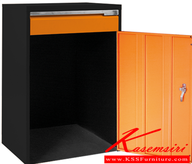
MGC36 ตู้เก็บเครื่องมือช่าง 1 บานเปิด 1 ล็อก 616(W) x 457(D) x 900(H) mm.