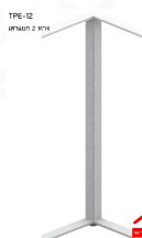
เสาเริ่ม/เสาค่อย