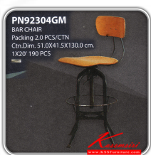
PN92304GM BAR CHAIR Packing 2.0 PCS/CTN Ctn.Dim. 51.0X41.5X130.0 cm 1X20' 190 PCS