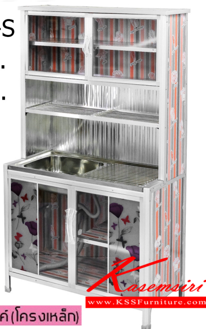
ตู้ครัวสูงอ่างซิงค์ (โครงเหล็ก)