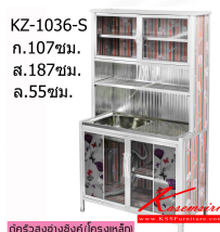
KZ-1036-S ก.107ซม. ส.187ซม. ล.55ซม.