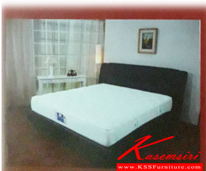
BACK CARE (POCKET SPRING)