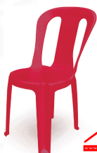
PN9145A Dim. 48 x 54 x 82 cm color : red