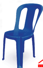
PN9145A Dim. 48 x 54 x 82 cm color : dark blue