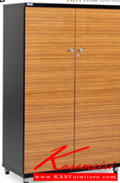
HB-EXCI810-HZB ตู้เอกสารกลางบานเปิด พร้อมแผ่นชั้น 2 แผ่น 800(W) x 400(D) x 1250(H) mm.