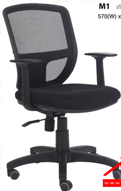
M1 เก้าอี้สำนักงาน มีเท้าแขน 570(W) x 575(D) x 900-1020(H) mm.