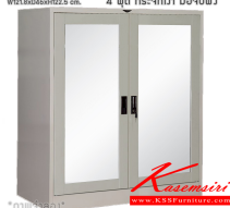
SC4FMRSM ตู้เอกสาร 2 บานเปิดกลาง W121.8xD46xH122.5 cm. 4 ฟุต กระจกเงา มือจับฝัง