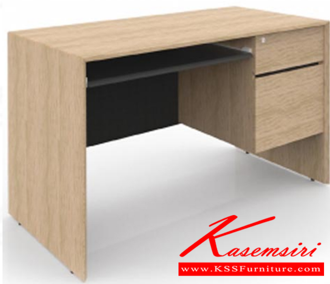
TSL1202/C W120xD60xH75 CM.