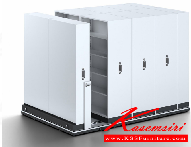
SV2-203 W200xL320xH200 cm.