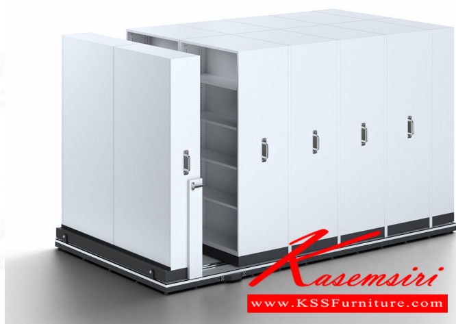
SV2-204 W200xL380xH200 cm.