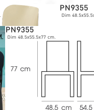
PN9355 Dim 48.5x55.5x77 cm.