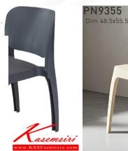
PN9355 Dim 48.5x55.5x77 cm.