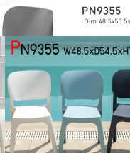
PN9355 Dim 48.5x55.5x77 cm.