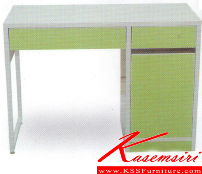
HO-01 W122 x D60 x H75 mm. ท็อปเคลือบเมลามีน ลื่นชักข้างมี 4 ชั้น และ 1 ลื่นชักวางคีย์บอร์ดได้

ท็อปเคลือบเมลามีน ลื่นชักข้างมี 4 ชั้น และ 1 ลื่นชักวางคีย์บอร์ดได้