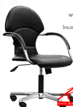
LG2/M W54xD54xH88 CM. หนังเทียม PVC โครงอลูมิเนียมปิดมา#58