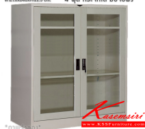
SC4FGLSM ตู้เอกสาร 2 บานเปิดกลาง W121.8xD46xH122.5 cm.