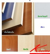
รายละเอียดสินค้า