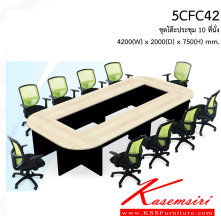
5CFC42 ชุดโต๊ะประชุม 10 ที่นั่ง 4200(W) x 2000(D) x 750(H) mm.