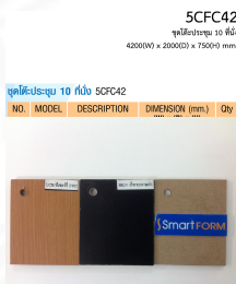
5CFC42 ชุดโต๊ะประชุม 10 ที่นั่ง 4200(W) x 2000(D) x 750(H) mm.