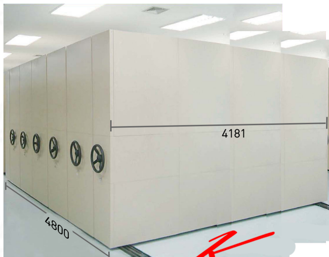
ภาพจากการตกแต่ง IEM-200