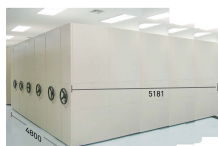
ภาพจากการตกแต่ง IEM-200