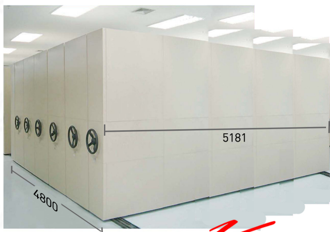
ภาพจากการตกแต่ง IEM-200