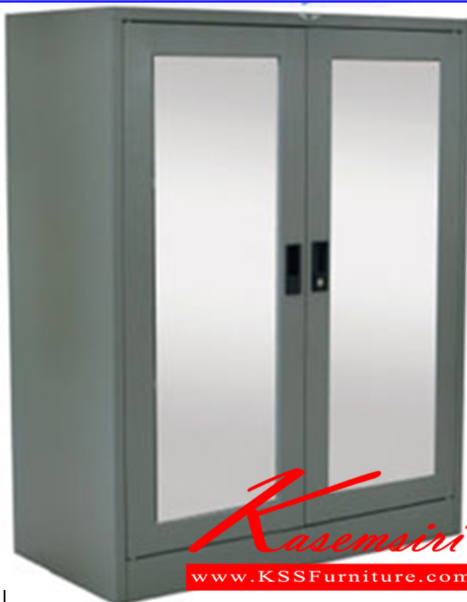
ภาพผ่านการตกแต่งรูป

SC3FMRSM 91.4(W) X 45.7(D) X 122.5(H) cm.