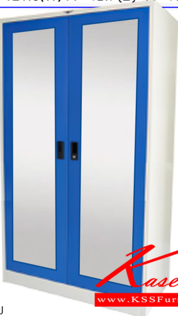
ภาพผ่านการตกแต่งรูป