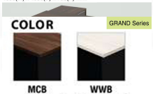
2EX1816R R/L (แบบ TOP 1 สี) 1800(W) x 1600(D) x 750(H) mm.