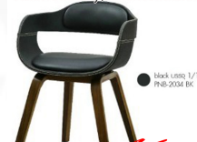
ชุดโต๊ะไม้2ที่นั่ง