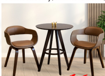
ชุดโต๊ะไม้2ที่นั่ง