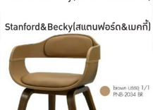
ชุดโต๊ะไม้2ที่นั่ง