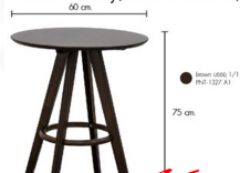
ชุดโต๊ะไม้2ที่นั่ง