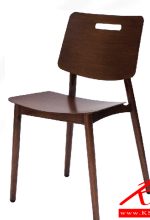
PN92285AL Dim. 46. x 47 x 77 cm Material: Aluminum