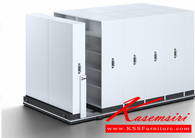
SV2-204 W200xL380xH200 cm.