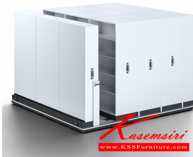
SV3-203 W300xL320xH200 cm.