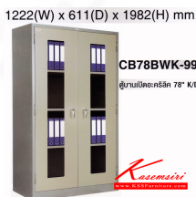
1222(W) x 611(D) x 1982(H) mm.