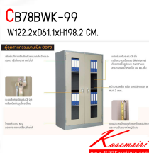
CB78BWK-99 W122.2xD61.1xH198.2 CM.