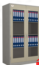
CB78BWK-99 ตู้ออกสารอะคริลิก 78" K/D 1222(W) x 611(D) x 1982(H) mm.