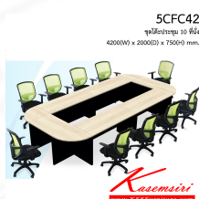
5CFC42 ชุดโต๊ะประชุม 10 ที่นั่ง 4200(W) x 2000(D) x 750(H) mm.