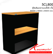
5CL800 ตู้ใส่แฟ้มเอกสารแบบตั้งได้ 2 ชั้น 800(W) x 400(D) x 850(H) mm.