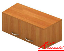
TCW ตู้แขวนติดผนังเอกสารไม้